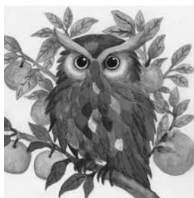
みかん畑の HAPPY OWL 太田・生品小5年 塚越 凜空さん