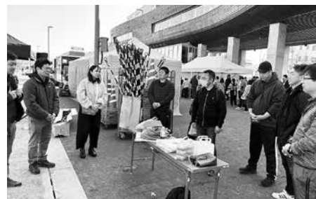
せとうちみなとマルシェへの協力