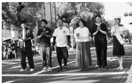
第28回おんまぐへの協力