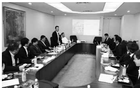
四国ブロック補完委員会意見交換会