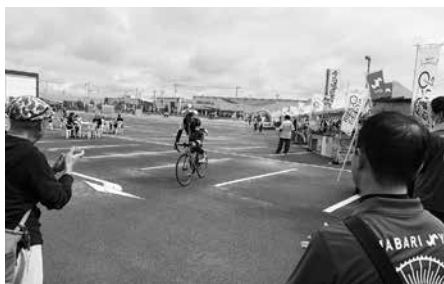
いまばりペダル2025への協力